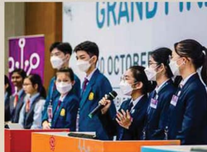
SEBAHAGIAN peserta pada acara akhir NSC 2022.

ngamalkan pendekatan pembelajaran melalui pembelajaran berasaskan pengalaman dan pembelajaran amali bermula dari peringkat awal pendidikan.