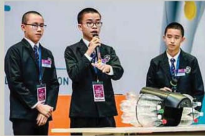
PELAJAR SMJK Jit Sin menerangkan prototaip yang dihasilkan.